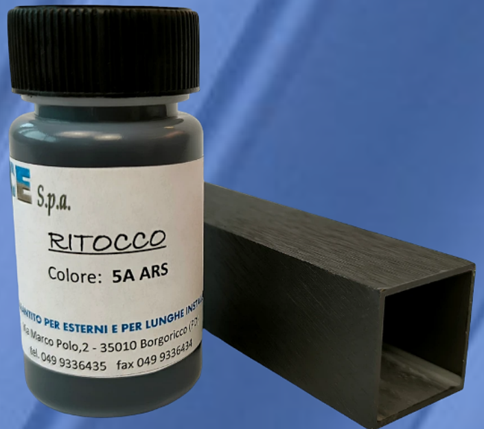
Particolare dopo l'operazione di ritocco